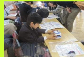
電機メーカーB社による ハイブリッドカー親子工作教室