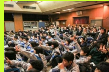
金融系A社による グローバル人材を目指す講演