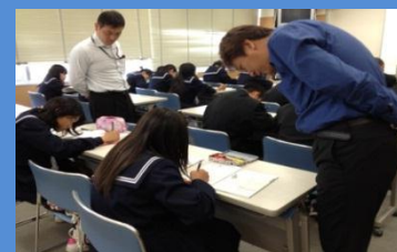
＜教員とのTTによる数学＞