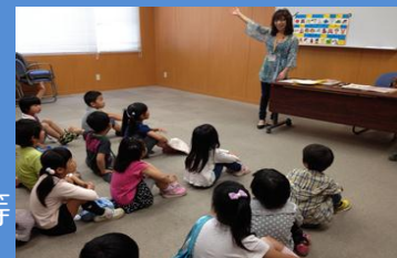
＜市民講師による英会話＞